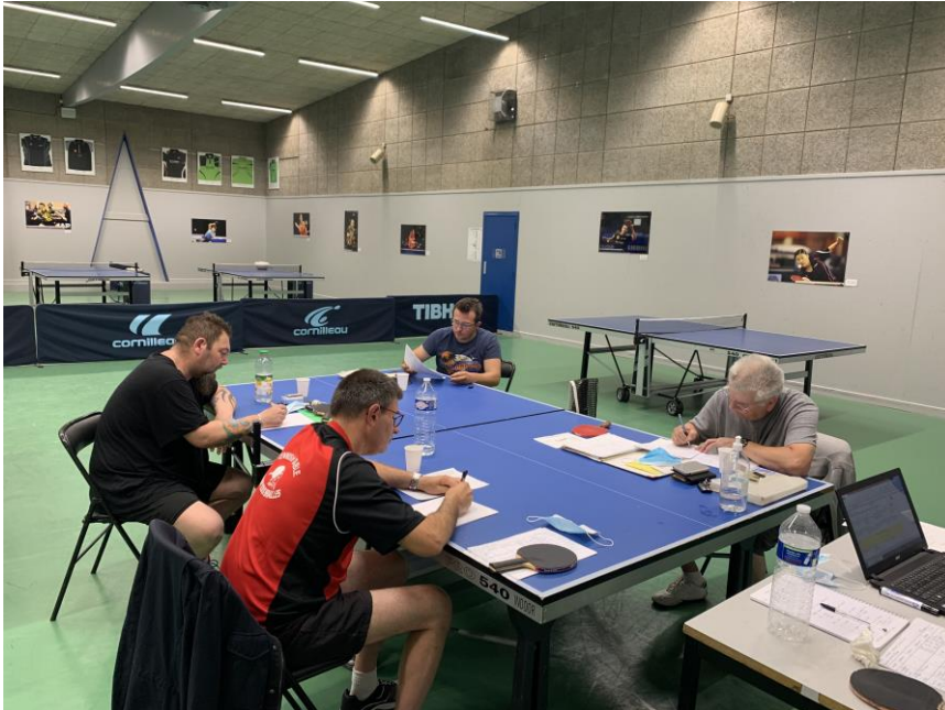
Très concentrés dans la préparation de leur séance