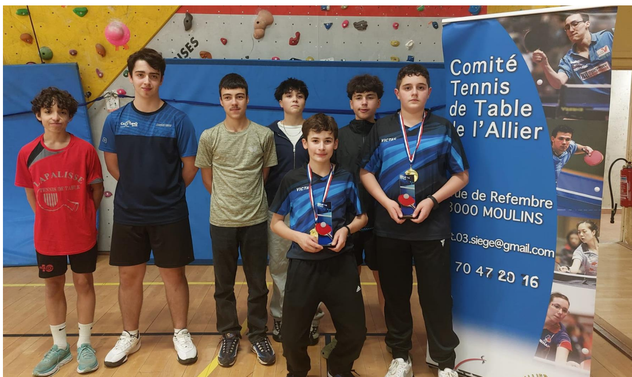
Les équipes du tableau Cadets – Juniors, DIVISION 1