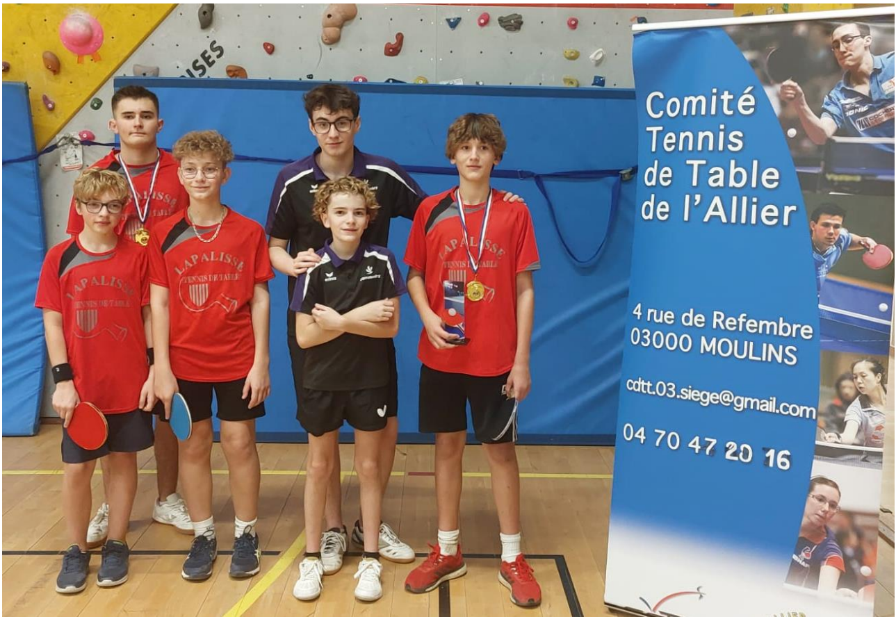
Les équipes du tableau Cadets – Juniors, DIVISION 3