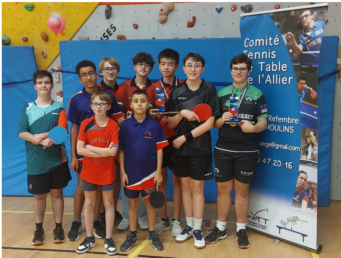
Les équipes du tableau Cadets – Juniors, DIVISION 4