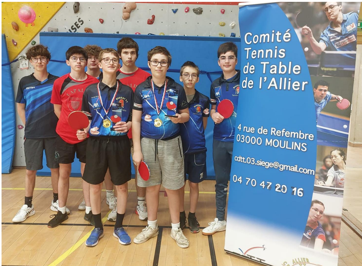
Les équipes du tableau Cadets – Juniors, DIVISION 5