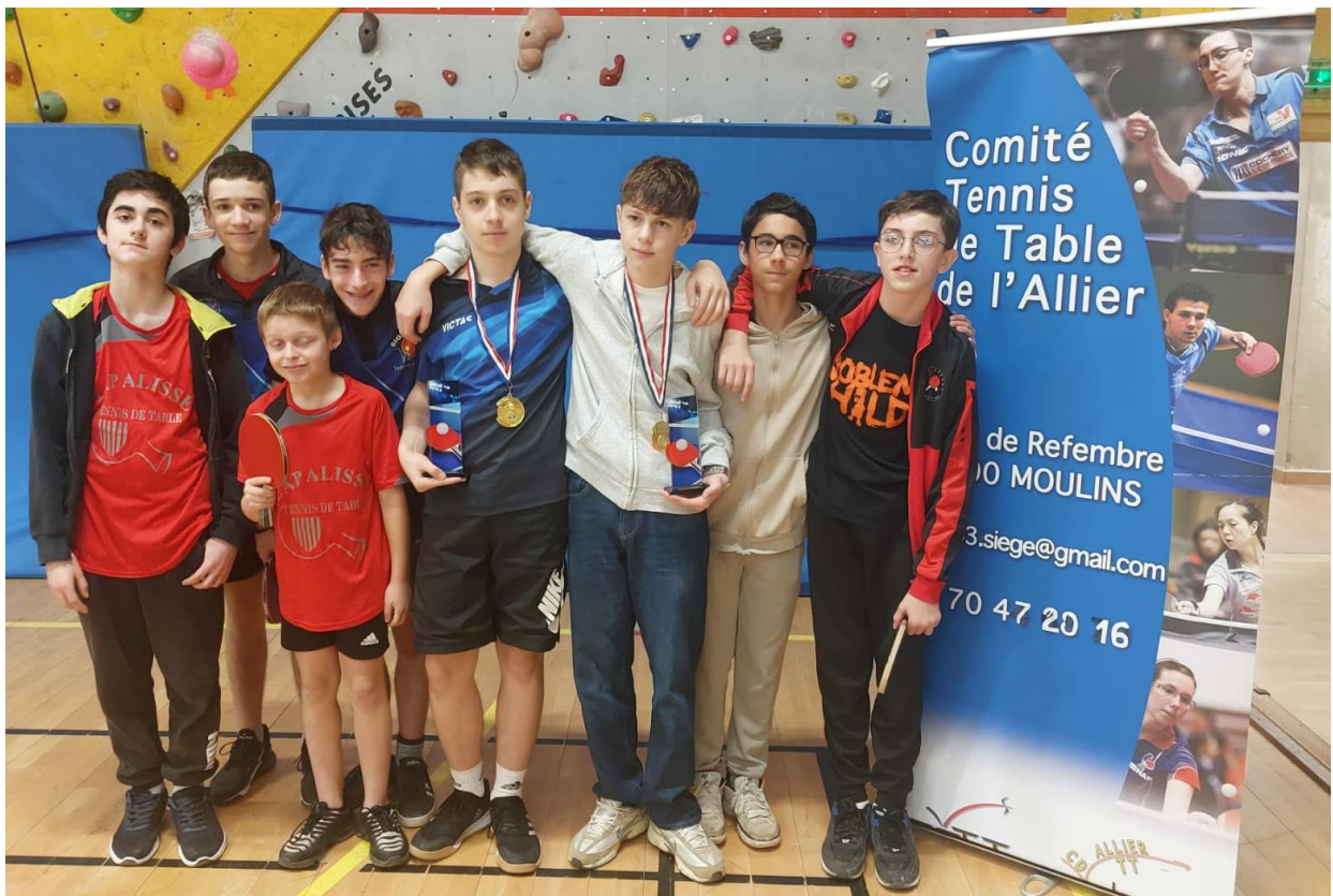
Les équipes du tableau Cadets – Juniors, DIVISION 6

Rendez-vous le 27 avril 2025 pour le prochain tour à Montluçon.