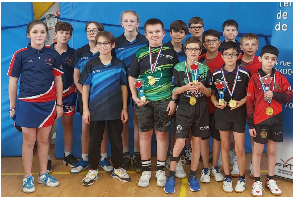
Les équipes du tableau Poussins-Benjamins- Minimes