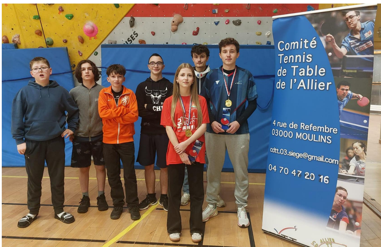
Les équipes du tableau Cadets – Juniors, DIVISION 2